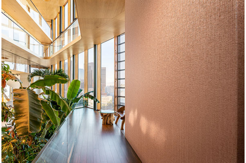
wallcovering – design Barkley

Barkley crea un ambiente natural dentro de una sala gracias al aspecto desgastado y la estructura orgánica de corteza de árbol. La amplia carta de colores (24 tonos) también está compuesta íntegramente de tonos naturales, entre los que se encuentran el caramelo, miel y rojo teja. Barkley tiene un aura mate con un brillo sutil y es ideal para hostelería y entornos sanitarios.