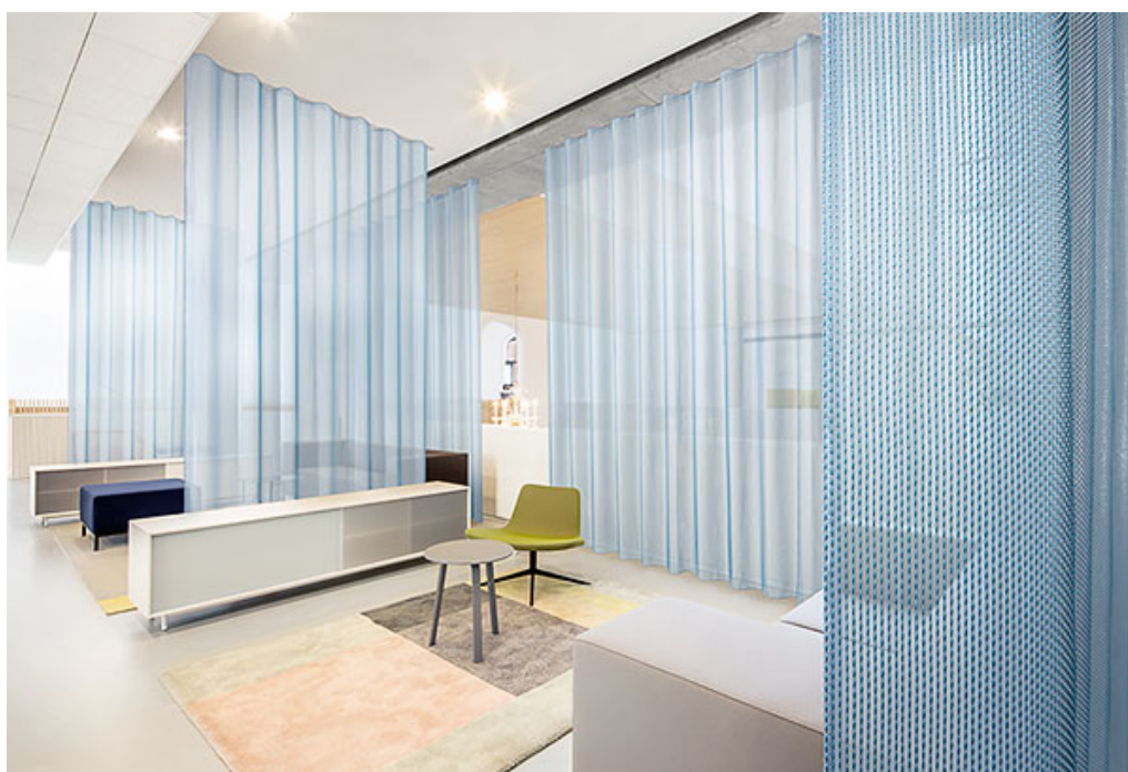
curtain – design Formoza

Volete migliorare l'acustica e la comunicazione in un locale, suddividere uno spazio aperto, creare un luogo di lavoro flessibile o più riservato? I nuovi colori delle tende Vescom Carmen, Marmara e Formoza offrono la soluzione. Tre design, ognuno con il proprio carattere, la propria colorazione e la propria atmosfera. Nonostante la loro trasparenza e il loro peso ridotto, i tessuti hanno un livello di assorbimento del rumore di 0,5 e 0,6 \alpha_w . Formoza e Marmara sono tessuti a doppia altezza.