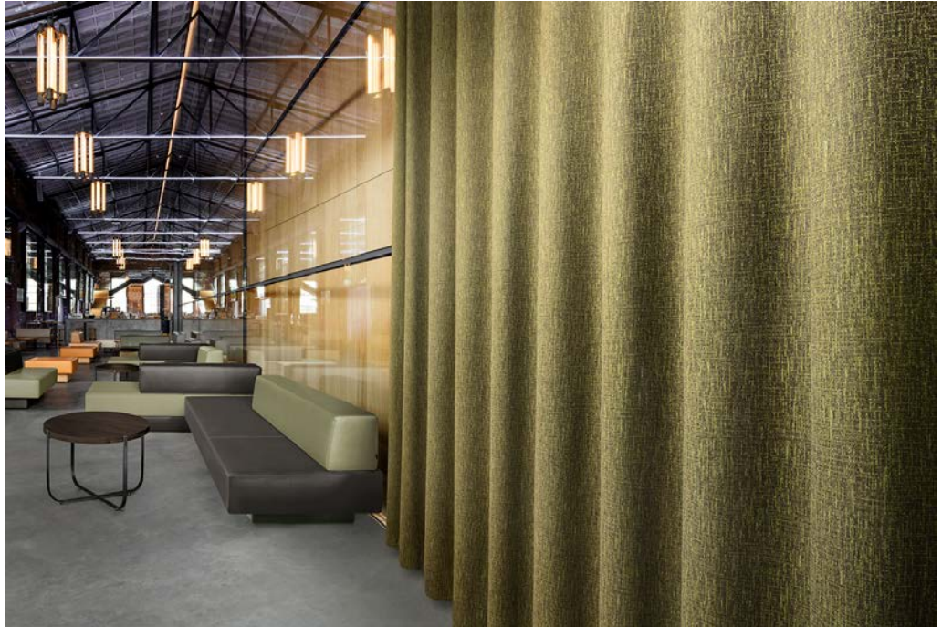
curtain – design Farasan

Farasan transforma qualquer atmosfera num espaço com estilo e classe. O seu brilho natural e o contraste multicolorido revelam uma aparência elegante e luxuosa. Farasan é da altura do cómodo e está disponível em nada menos do que 16 cores especiais como esmeralda, âmbar, cobalto e jade.