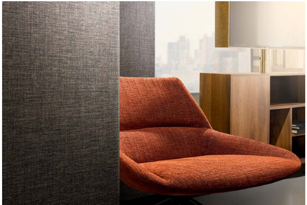
upholstery – design Fuga

Fuga é um “chenille” macio com uma aparência clássica; um tecido que vem enriquecer a oferta da nossa coleção. Todas as 26 cores dão uma sensação de hospitalidade acolhedora e confortável.