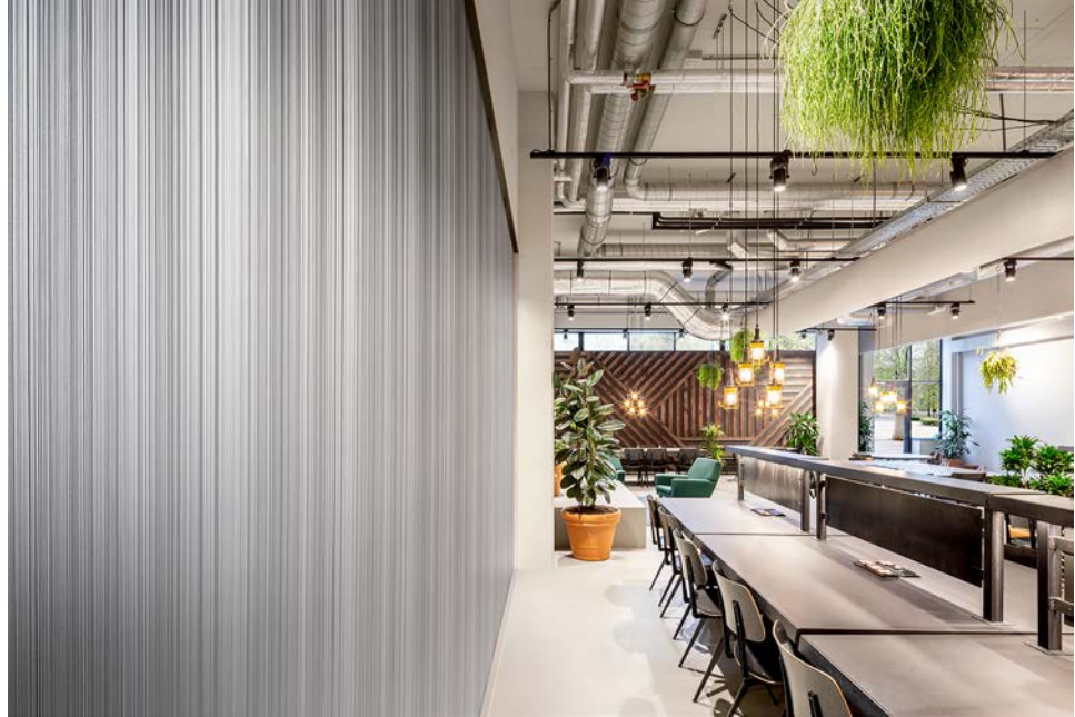
wallcovering – padrão Tonga

Florence a sua maravilhosa simplicidade dá a cada parede uma aparência têxtil exclusiva. Graças ao seu aspecto sedoso, o revestimento transmite um brilho repleto de riqueza e estratificação. A paleta de cores mostra uma interessante variedade: com realce para um encantador esmeralda e um atrativo verde tropical. A vasta oferta de cores (30 cores) torna Florence amplamente aplicável.