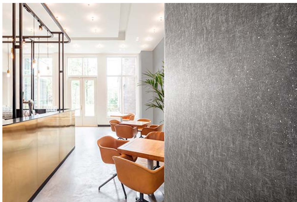
okleina ścienna – wzór Montado