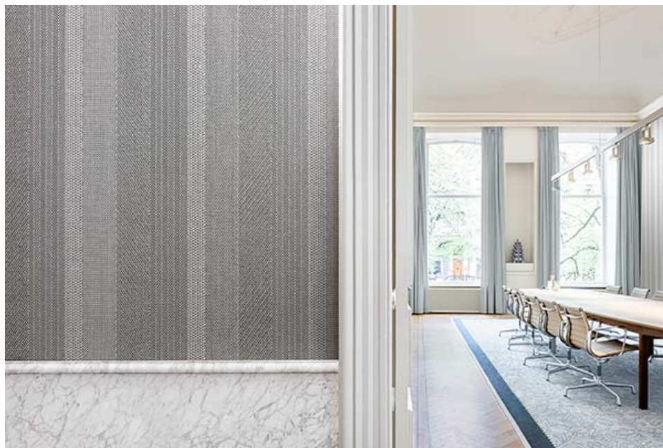
okleina ścienna – wzór Switch

"Włączenie Linen i Switch do kolekcji z takimi produktami jak Meteor i Strie jest uzasadnione," mówi Müller. "W tej kolekcji nie chodzi o dekorację czy ornamentykę; chodzi w niej o stworzenie tekstylnych oklein ściennych o właściwościach typowych dla Xorel."