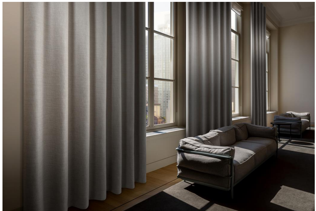
curtain – design Rani

Vescom vient d'ajouter à son offre de rideaux occultants trois qualités black out et trois variantes dim out. Chacune de ces variantes possède son propre look & feel. Les rideaux sont ignifuges, à hauteur de pièce, durables, indécourageables et inaltérables. En outre, la plupart sont même lavables à 70 degrés. Les étoffes occultantes prouvent qu'esthétique et fonctionnalité sont parfaitement compatibles. Malgré leur pouvoir occultant élevé, les étoffes offrent l'apparence agréable du tissu, créent une ambiance conviviale et tombent doucement.