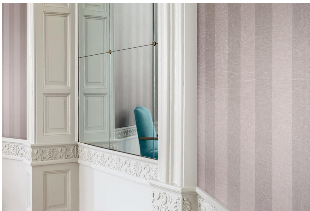
okleina ścienna – design Puccini

Puccini to elegancka, klasyczna i jedwabista okleina. Dostępna jest w naturalnych i nowoczesnych odcieniach. W swojej ofercie zawiera także kilka kolorów dopasowanych do kolorów okleiny Florence. Doskonale sprawdzi się w sektorze usług hotelarskich.