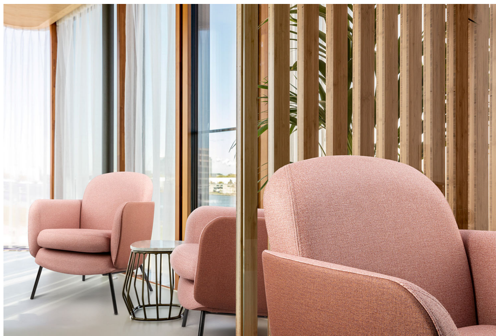
upholstery – design Creek

Le célèbre relief cuir Leone Plus provient d'une toute nouvelle série de couleurs. Ses 26 couleurs unies, mates ou satinées, offrent d'élégantes nuances de cuir. Beige, verts et différentes teintes de gris et de terre. Leone Plus est extrêmement souple et offre une apparence luxueuse.