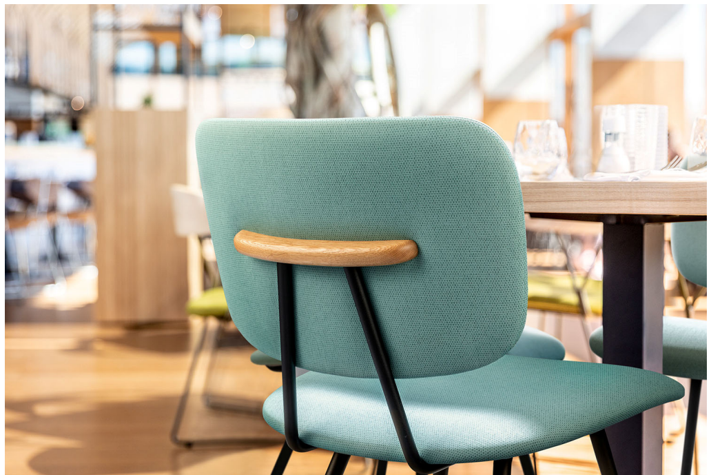
Möbelstoffe – Dessin Arrow

Mit seiner klaren, subtilen Textiloptik ist das Dessin Arrow ein Newcomer mit frischer und moderner Ausstrahlung. Arrow steht in 23 aktuellen, trendigen Farben wie Aquagrün, Rost und Stein zur Verfügung.